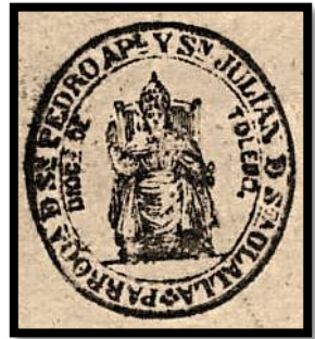
Sello de las dos Parroquias Refundidas 1890

encontrar inventarios o pagos por obras, retablos, etc.; también destacan los libros de cofradías algunas hoy desaparecidas como la de Animas (1736), Vera Cruz (1722), La Magdalena del despoblado de Pedrillana (1656), San José (1903) y otras que perduran como la de la Santa Caridad, con su denominación actual del Cristo de la Caridad (1584), o la Esclavitud de la Virgen de la Piedad (1675).