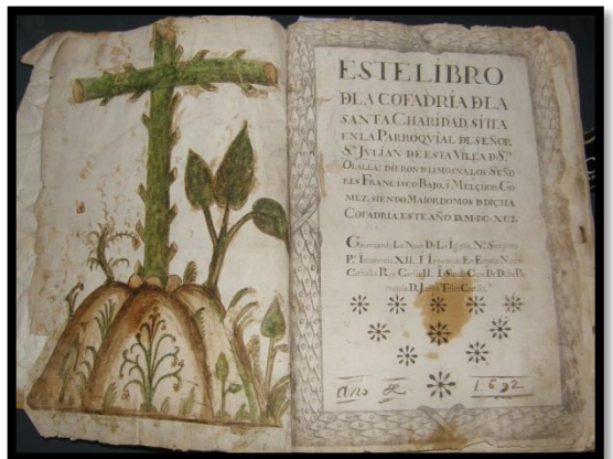
Libro de Actas de la Santa Caridad - 1692

Nuestro archivo conserva para ambas parroquias libros sacramentales de bautismos, matrimonios y defunciones; libros de carácter económico: memorias, capellanías, testamentos, protocolos notariales y especialmente destacan por su interés los "Libros de fábrica" que recogen ingresos y gastos de cada parroquia y en los que podemos