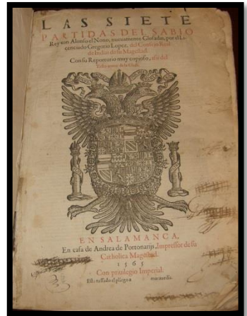
Siete Partidas de Alfonso X 1265

En esta ocasión el turno ha sido para el Archivo Parroquial de Santa Olalla, con la exposición "Codex Sanctae Eulaliae" (Códices de Santa Olalla), un archivo que abarca los dos archivos de las antiguas parroquias de nuestro pueblo San Julián, cuyo primer libro parroquial conservado es de 1550, y San Pedro, cuyo primer libro conservado es de 1568.